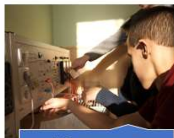
Кабинет технологии изготовления деталей авиационных приборов