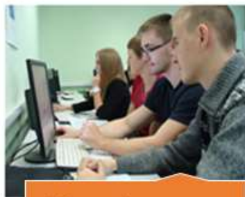
Кабинет информационных технологий