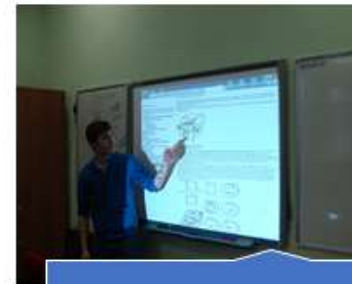
Кабинет инженерной графики