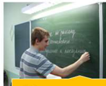
Кабинет русского языка и литературы