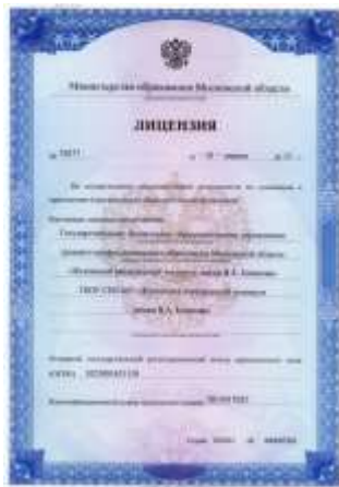
Лицензия №70577 от 10 апреля 2013 г.

В 2012-2013 учебном году Раменский филиал ГБОУ СПО МО «Жуковский авиационный техникум имени В. А. Казакова» получил свидетельство государственной аккредитации и успешно прошел лицензирование образовательной деятельности.