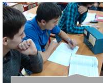
Кабинет математики и физики