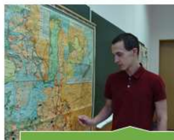
Кабинет социально-экономических дисциплин