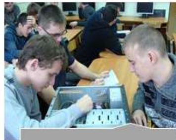
Кабинет вычислительной техники