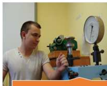
Кабинет авиационных приборов и комплексов