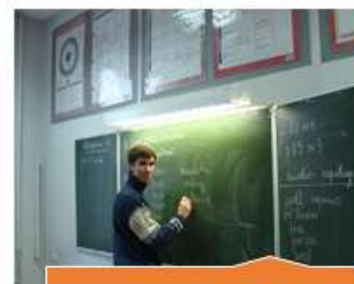
Кабинет иностранных языков