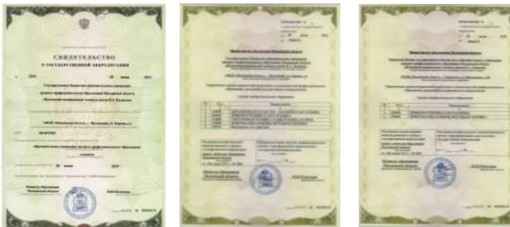
Аккредитация №2234 от 28 июня 2013 г.

В настоящее время в Раменском филиале занимаются 16 учебных групп: 12 – дневного отделения, 4 – вечернего, работают курсы интегральной подготовки к междисциплинарным экзаменам для студентов выпускных групп, курсы по подготовке к сдаче единого государственного экзамена, подготовительные курсы для поступающих в техникум.