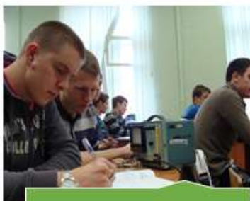
Кабинет деталей авиационных приборов